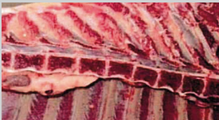
Canal medul·lar net